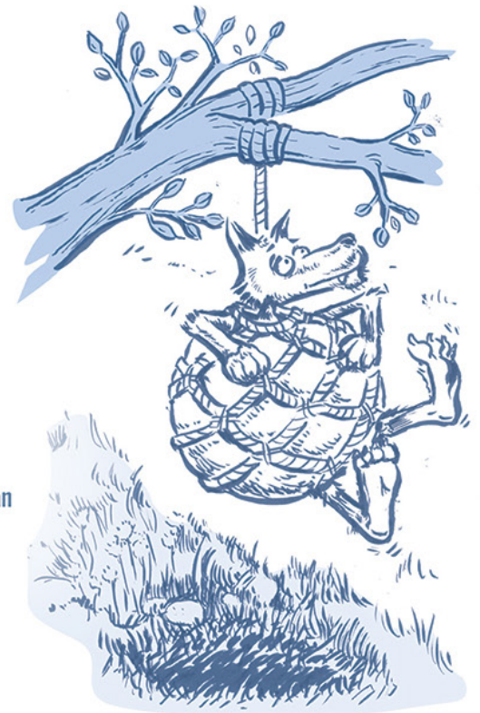
Che tapet ar bleiz !