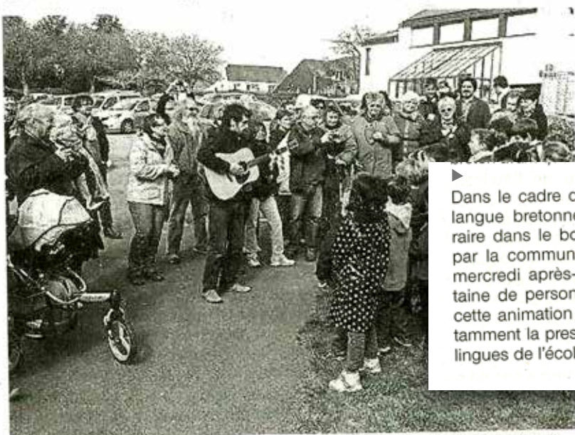
Les élèves bilingues de l'école du Pont Douar ont chanté et lu des poèmes en breton avant que ne démarre la balade ponctuée d'escalas littéraires.

Semaine de la langue bretonne : une balade très réussie