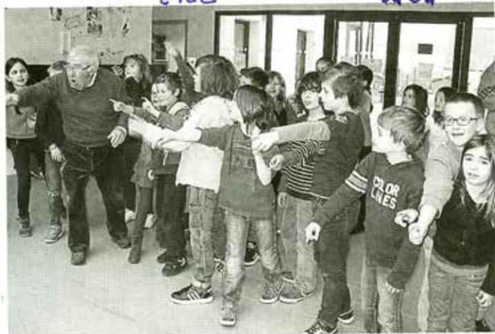
« Adran, arak » (an avant en arrière) ont appris à dire les élèves de CE2 et CM1.

L'école de La Barre sensibilisée à la langue bretonne