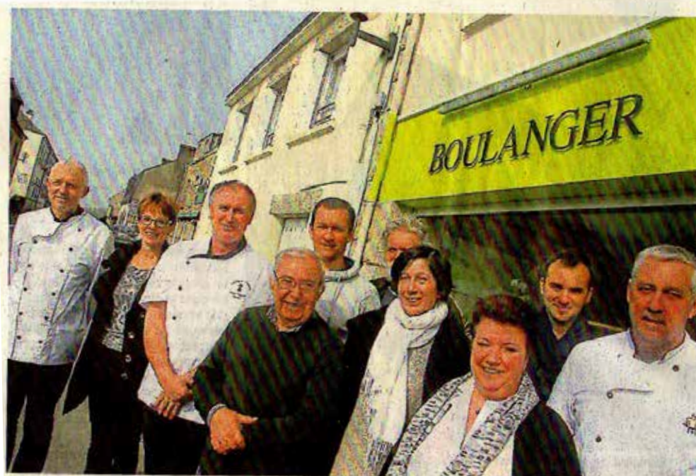
Au fil de rendez-vous vivants et originaux, la Semaine de la langue bretonne organisée par Ti douar Alré immerge le pays d'Auray dans un bon bain de breton.

Avec Ti douar Alré, le pays d'Auray se met au breton du 28 mars au 6 avril. Initiations, animations, cinéma, colloque et apprentissage au quotidien dans les boulangeries sont au menu de cette troisième édition.