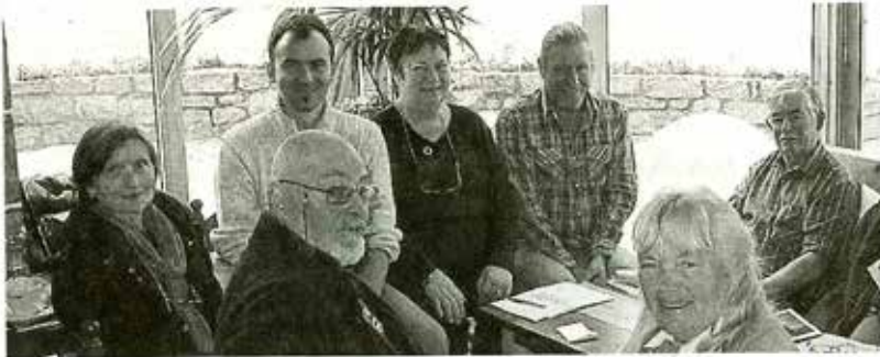
Les élèves de breton se retrouvent le jeudi, de 16 h 30 à 18 h.