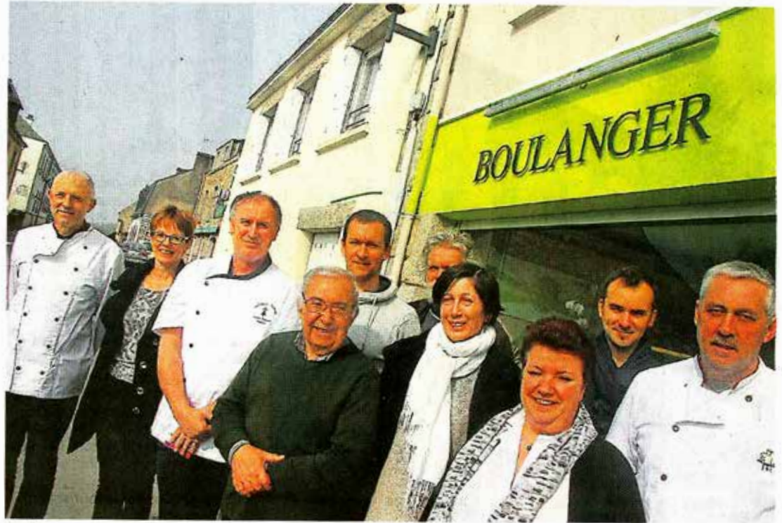
Au fil de rendez-vous vivants et originaux, la Semaine de la langue bretonne organisée par Ti douar Alré immerge le pays d'Auray dans un bon bain de breton.

Le programme, à la fois copieux et ludique (lire ci-dessous) peut aussi être très sérieux. Mais pas ennuyeux. Le nouveau colloque organisé samedi 4 avril au lycée de Kerplouz, en est l'exemple vivant. Ce jour-là, des chercheurs